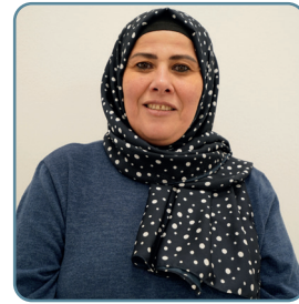
Ayzin Bıyıklı Kadın Kolları Başkanı