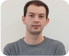
Ahmet Özbağ Sosyal Medya